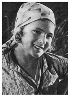
Гуля в роли Василинки. Кадр из кинофильма «Дочь партизана», 1934 г.