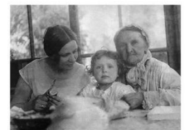
На даче у бабушки Кати в Новогорено, 1926 г.