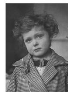
«Мам, вы опять гулять?»