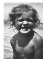
«Море по колено!» Геленджик. 1925 г.