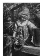
Весёлое лето. Геленджик. 1925 г.