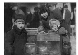
Из семейных кинофильмов «Каштанка». 29 марта 1926 г.